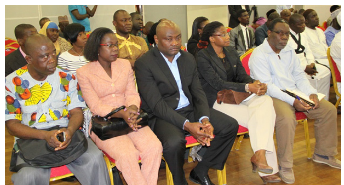
...d'invités ont honoré de leur présence la cérémonie