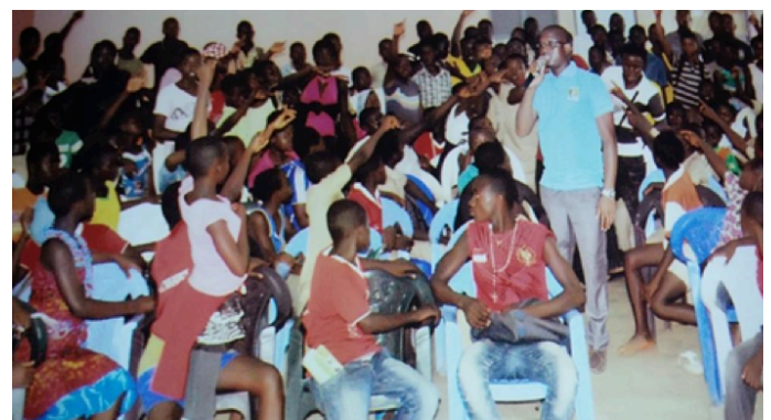
Séance de sensibilisation au Collège Moderne de DIVO

Remontez-nous toutes les informations en écrivant à info@cicg.gouv.ci ou appelez le 20 31 28 28