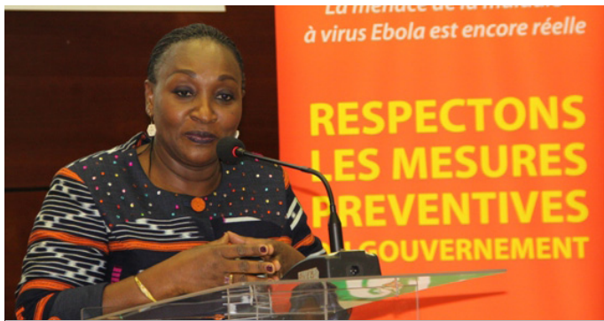
Madame le Ministre au cours de son adresse a salué l'engagement des leaders religieux