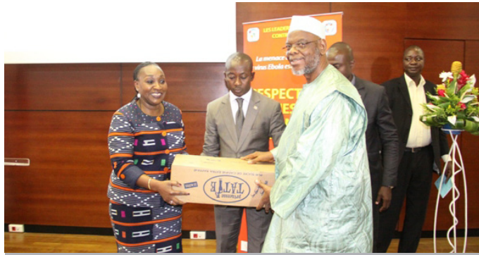
Madame le Ministre à symboliquement remis du lait et du sucre au musulmans présents pour les soutenir en ce 1er jour du mois de Ramadan