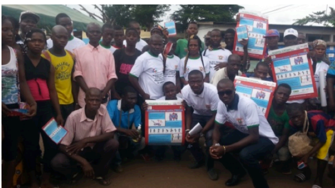
Photo de groupe à la fin de la cérémonie de sensibilisation à Bangolo