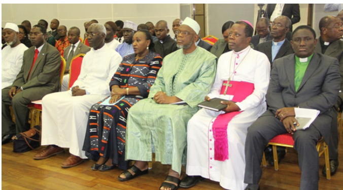
Un parterre d'officiels et ...