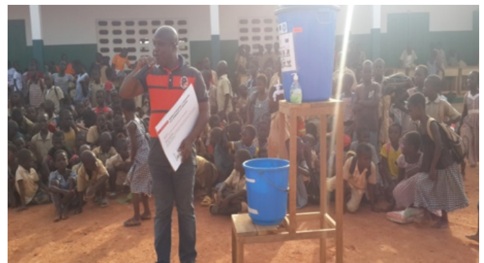
Séance de sensibilisation scolaire au groupe scolaire Dominique Ouattara de San- Pedro