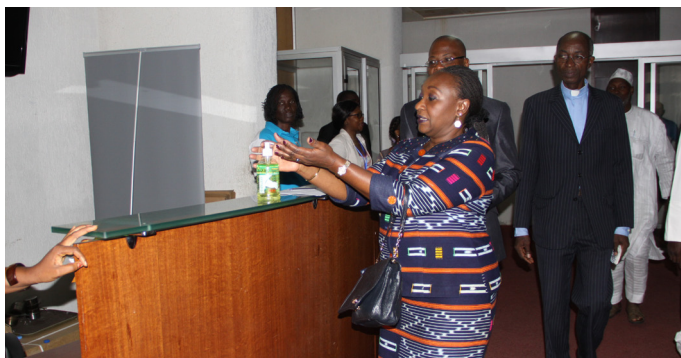
Mesure préventive oblige, la Ministre se soumet à l'utilisation du gel main à son arrivée