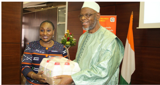
Les leaders religieux ont tenu à faire des dons pour soutenir le Ministère dans la lutte contre la MVE