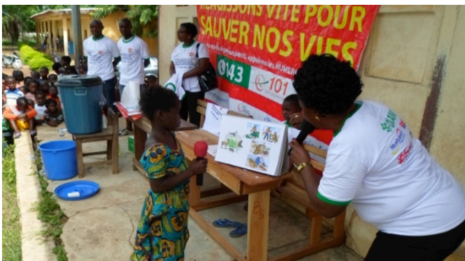
Séance de sensibilisation scolaire sur le mode de transmission du virus Ebola à EPP Blanfla de Bouaflé